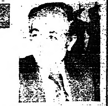
كتب نقبل ملك

والتي منذ سنوات ، لا تزال مصر على موقفي بالدعوة الى اسهام الاموال العربية في مشاريع اناجية ضمن الدول العربية ، لان هذا النوع من الاستثمار هو اكثر امانا ، وهو يند الشباب والدول والاسهام بها . وقد سبق ليورصة بيروت ان اضرحت على جامعة الدول العربية اقتراح الحكومات العربية بفترة اقلية اسواق مالية لديها ، وبدأ بالبورصات ومن ثم بتشجيع قيام الشركات المساهمة ، وبنياد الاسهم بين بورصات الدول العربية .